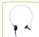
Knochenleitungs- hörer B71