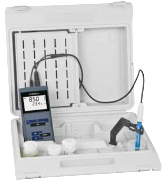
Set im Tragekoffer

Das Kofferset dient auch als kleines Feldlabor.