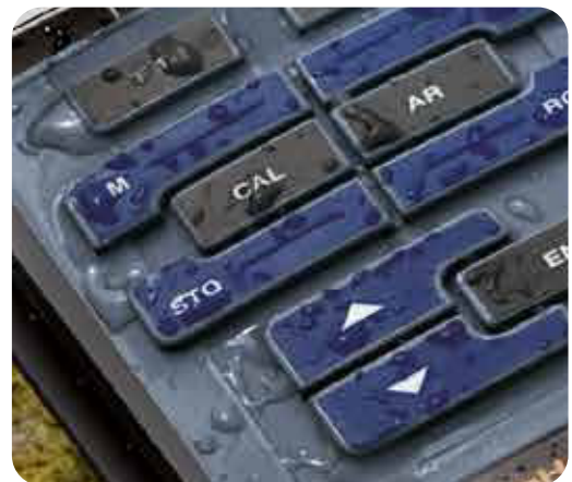
Robuste Silikontastatur mit geschlossener Oberfläche - 100% wasserdicht