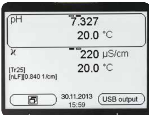
Display mit Messwertdarstellung

Das Multi 3320 für die Messung von pH, ISE, Redox, Leitfähigkeit und gelöstem Sauerstoff (elektrochemisch) ist ein ideales Gerät für Umweltsanwendungen im Bereich der Grund- und Oberflächenwassermessung, in der Aquakultur sowie in der Kläranlage und vielem mehr. Auch gelegentliche einfache ISE-Messungen deckt dieses Gerät ab.