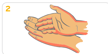
2 Die Creme Handrücken auf Handrücken über die gesamte Fläche verteilen.