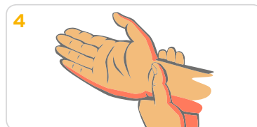
4 Nägel und Nagelfalze mit der Creme versorgen. Die Reste der Creme werden dann an den Handgelenken einmassiert.