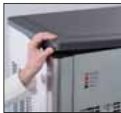
PS Plastik Abdeckung