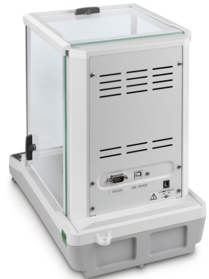
KERN ACS/ACJ mit serienmäßiger Datenschnittstelle RS-232 und USB

Der Bestseller unter den Analysenwaagen, mit hochwertigem Single-Cell Wägesystem, auch mit Eichzulassung [M]