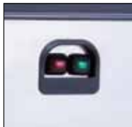
Front ON-OFF Schalter