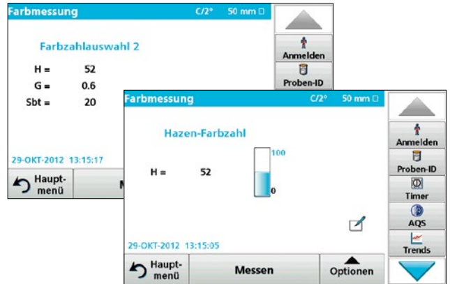
Je nach individueller Kundenbranche und -anwendung sind die drei wichtigsten Farbzahlen auf einen Blick darstellbar. Anzeige im individuell konfigurierbaren Balkendiagramm mit einstellbaren Messbereichsgrenzen.

Außerdem macht Lico Qualitätskontrollen sehr flexibel: Messwerte sind in allen Skalen auswertbar, auch nachträglich durch gespeicherte Spektraldaten.