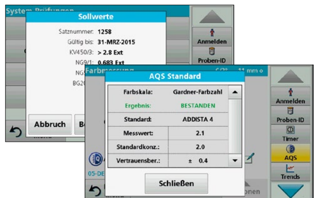
Zertifizierte Prüffilter, rückführbare Addista Color Standardlösungen und eine integrierte Durchführung der AQ5-Maßnahmen gewährleisten optimale Messwertsicherheit.