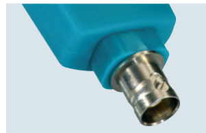
testo 206-pH3: pH3-Sondenkopf mit BNC-Schnittstelle