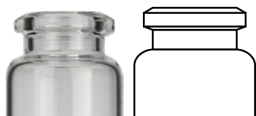
Beveled Top Headspace Crimp Neck