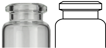
Abgeschrägter Headspace Rollrand