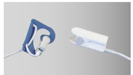
Messung der Sauerstoffsättigung