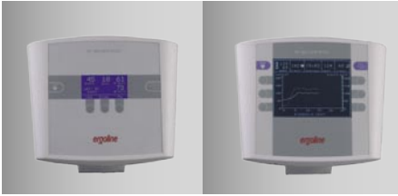
Unterschiedliche Bedien-Einheiten (P und K)