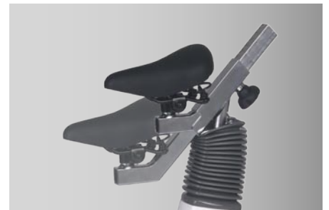
Sattelverstellung für Kinder-Ergometrie