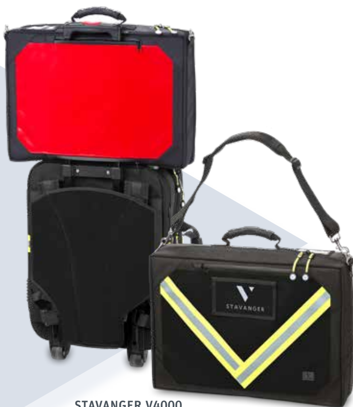
STAVANGER V4000 wahlweise in rot, schwarz und neongelb erhältlich