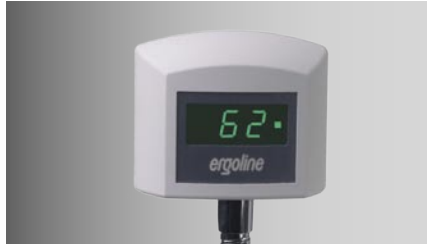
Patienten-Anzeige der Drehzahl