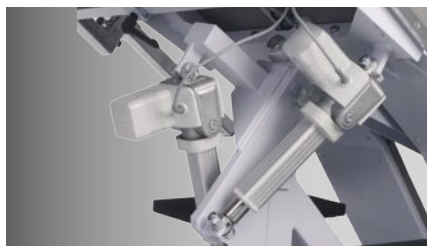
Motorverstellung für „neigen“ und „kippen“