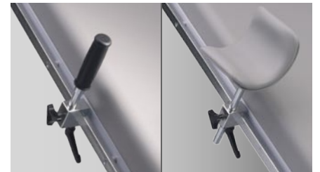
Normschiene zur Zubehörfestigung