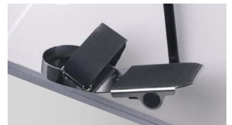
Pedalschuhe mit Klettband-Befestigung