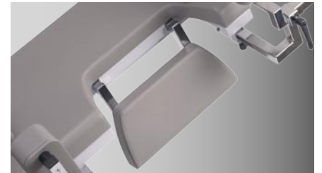
Spezialpolster für Ultraschall-Untersuchung